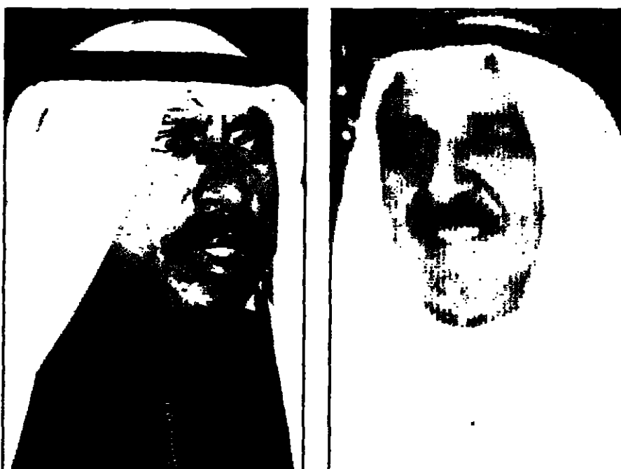
صباح الاحد الصباح